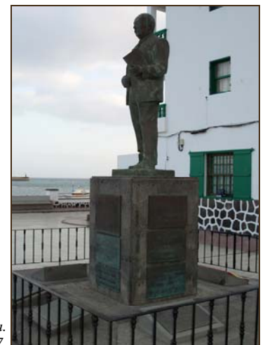
Monumento a Blas Cabrera. Arrecife. 2007.