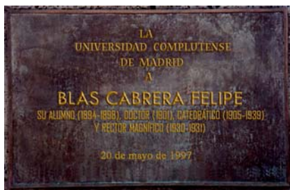
Universidad Complutense de Madrid. 1997.