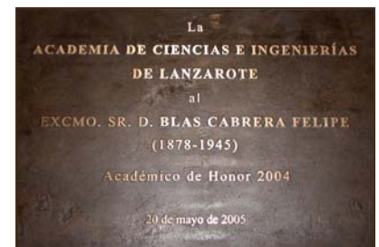
Academia de Ciencias e Ingenierías de Lanzarote. 2005.