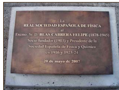
Real Sociedad Española de Física. 2007.