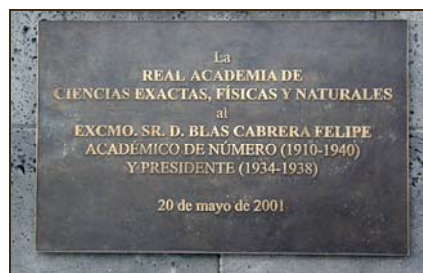
Real Academia de Ciencias Exactas, Físicas y Naturales. 2001.