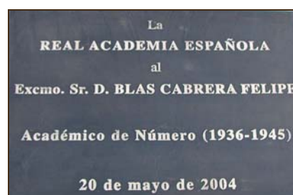
Real Academia Española. 2004.