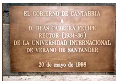
Gobierno de Cantabria. 1998.