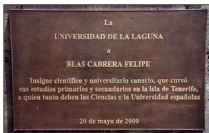
Universidad de La Laguna. 2000.