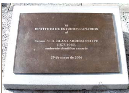
Instituto de Estudios Canarios. 2006.