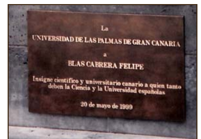
Universidad de Las Palmas de Gran Canaria. 1999