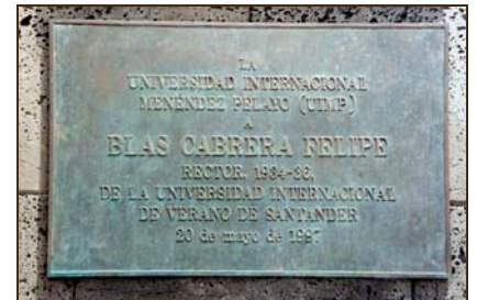
Universidad Internacional Menéndez Pelayo (UIMP). 1997