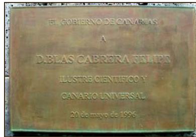
Gobierno de Canarias. 1996.

Una institución relacionada con Blas Cabrera rinde homenaje de reconocimiento y gratitud al ilustre científico canario con descubrimiento de una placa y unas “palabras” de homenaje.