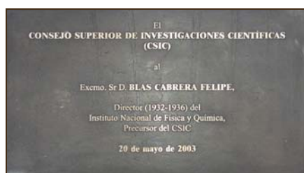
Consejo Superior de Investigaciones Científicas (CSIC). 2003.