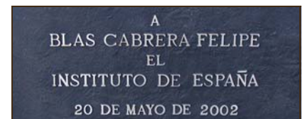
Instituto de España. 2002.