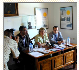
Rueda de Prensa. Presentación de las actividades culturales complementarias de los VI Cursos de Verano. 18 de mayo de 2001.