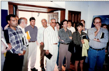
Presentación de los módulos interactivos a profesores de la isla. 1997.