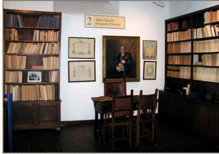
Recepción del Legado de Julio Palacios. Centro Científico-cultural Blas Cabrera. 14 de noviembre 1996.