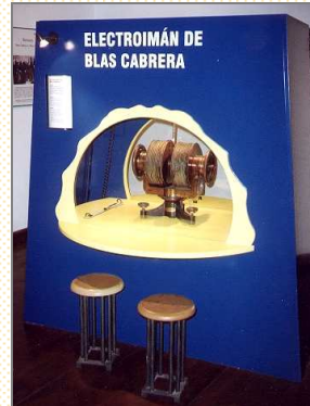
Inauguración de módulos magnéticos interactivos. 14 de octubre de 1997.