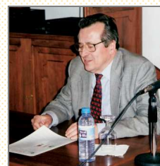
Presentación del Boletín Informativo "El Magnetón". 20 de enero de 2000.