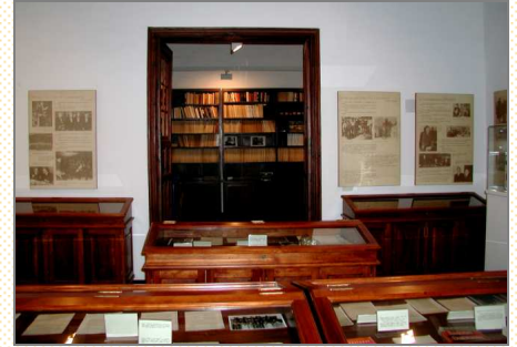
Exposición "julio Palacios, primer discípulo de Blas Cabrera". Centro Científico-cultural Blas Cabrera. Noviembre 1996.