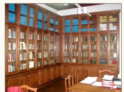
Biblioteca del Centro. 2004.