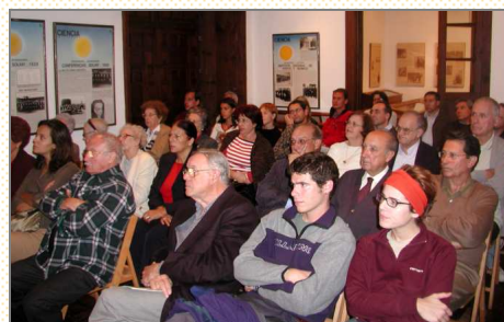
Sala de Conferencias del Centro. Diciembre 2003.