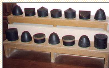
Piezas polares del electroimán gigante de Blas Cabrera procedentes de la Universidad de Zaragoza. En préstamo en el Museo Elder de la Ciencia y la Tecnología de Las Palmas de Gran Canaria.