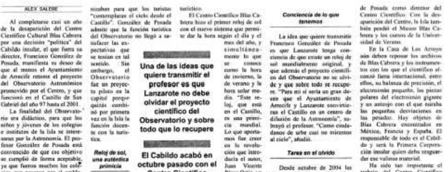
El observatorio astronómico Blas Cabrera en el momento de su inauguración.

El profesor señala que cualquier ciudad envidiaría tener un auténtico reloj de sol como el que permanece en el Castillo, reproducido 18 veces en distintos lugares del mundo