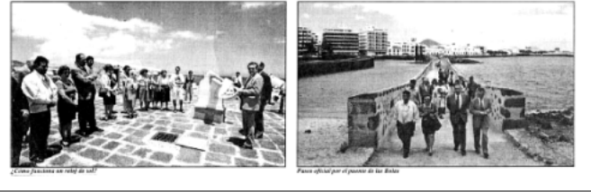
El nuevo observatorio en el Castillo de San Gabriel.