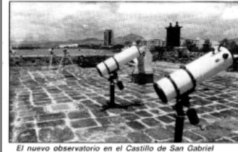
El nuevo observatorio en el Castillo de San Gabriel