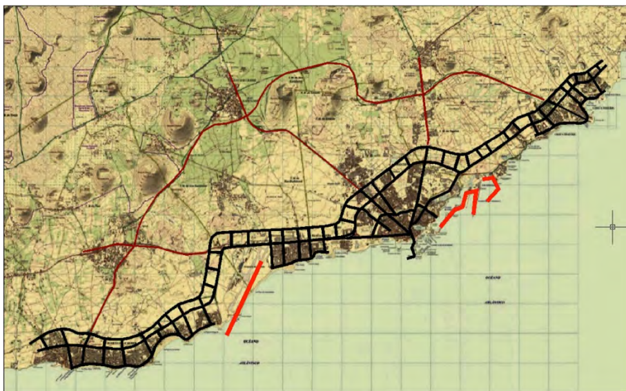
La traza secuencial. Conurbación de Arrecife.

Arrecife forma parte destacada de esta conurbación, a la que se ha visto unida más por la insistencia de los usos y costumbres de las personas que por el acierto en la aplicación de los planes urbanísticos de carácter estratégico.