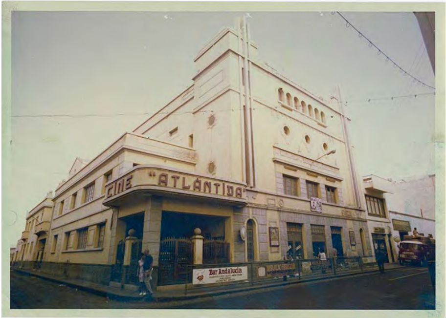
Cine Atlántida (demolido) c.1970.

Si además es notorio que ni siquiera en los planes de vivienda —¿qué fue de ellos?— se ha programado hasta la fecha ninguna estrategia de retorno de los residentes al centro de la ciudad a través de la rehabilitación; si ha quedado claro que a cientos de responsables de diversas administraciones públicas y privadas no les ha parecido buena idea instalarse en inmuebles antiguos; si este es, en definitiva, el talante generalizado entre quienes formulan las normas y catálogos, es obligado concluir que la política de patrimonio, necesaria en sí misma, se ha venido programando en Arrecife con criterios equivocados.