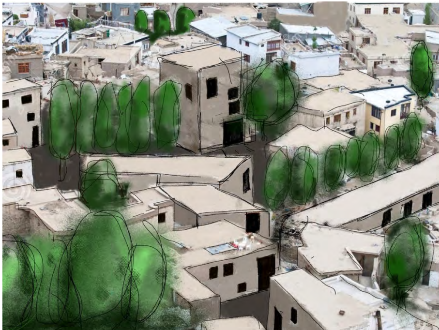
Ciudad del árbol verde.

naturaleza, es elección consciente de cultura. El árbol es un anciano al que no vimos nacer y también es un niño al que no veremos morir. Es el árbol verde y alto la pieza que construye la ciudad. Después vienen los edificios.