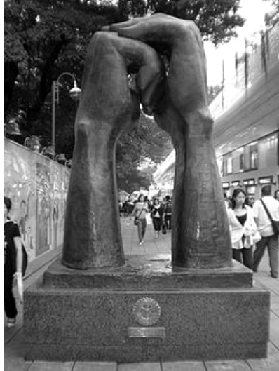
Una estatua realizada por Van Lau en la entrada este del parque Kowloon en Kowloon, Hong Kong; donación del Rotary Club de Kowloon West.

El tiempo no nos permite proseguir mencionando a tantos otros rotarios dedicados que introdujeron programas como Albergues de Bajo Costo, o Preservemos el Planeta Tierra, o la Asociación Internacional de Rotary, o RYLA, y una docena más de proyectos, programas y actividades que han producido una poderosa atracción a los miembros de Rotary.