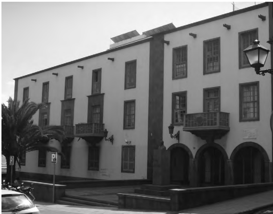
Fachada del Ed. de las Academias Municipales en Las Palmas de Gran Canaria de estilo neocanario. Sede de la Escuela Luján Pérez desde 1956. Proyecto de Secundino Zuazo.

6.- En la C/ Roque Morera, nº 1 (hoy plaza de la R.S.E.A.P.), 1ª Planta del Edificio de las Academias Municipales, que es propiedad de la Real Sociedad Económica de Amigos del País, ocupando la Sala Este que da al mar en la Avenida Marítima. La “Escuela” volvió a Vegueta y en esta 1ª Planta estuvo desde 1956 hasta 2001.