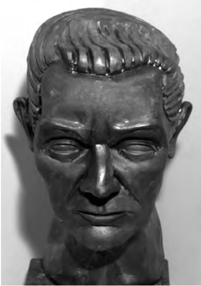
Busto de Fray Lesco. Obra de Orlando Hernández. Col. ELP.