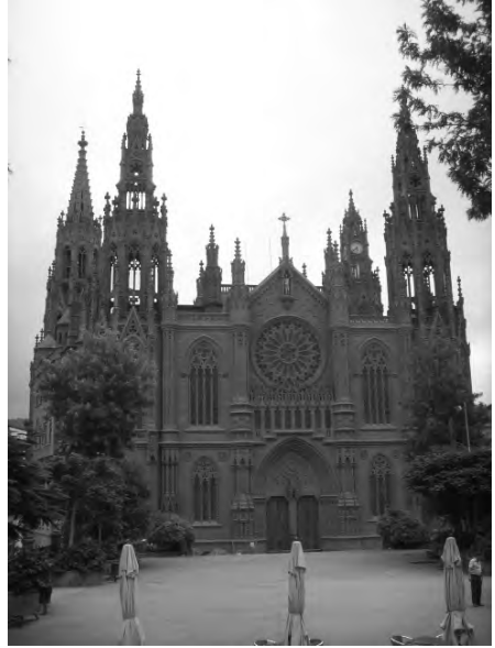
Templo de la Ciudad de Arucas. Arq. M. Vega y March. 1908.

“Fray Lesco” adivinó en los canteros de Arucas al labrante que transforma la materia para darle utilidad, al que tiene oficio y destreza manual, dominando una técnica que se puede trasladar a la creatividad artística con la toma de conciencia “de la visión intuitiva de la individualidad” de su propia personalidad, tal como aseveraba B. Croce en su ensayo en 1893, “La historia subsumida bajo el concepto general del arte”, donde afirmaba que el arte no es una actividad cognitiva: es conocimiento de lo individual, asemejándose en esto a la historia, que se ocupa totalmente en “narrar hechos” individuales concretos, llegando a la conclusión que historia y arte son precisamente la misma cosa: la intuición y representación de lo individual, a diferencia de la ciencia que es conocimiento de lo general, o sea, construcción de conceptos generales y el establecimiento de relaciones entre ellos.