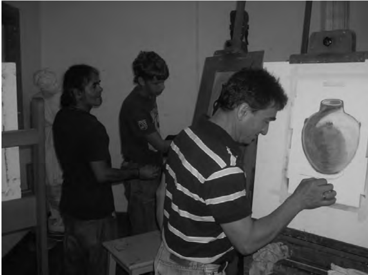
Profesor y alumnos en el Taller de Dibujo. 2009.

del 1 er Patronato que tuvo la Escuela cuando al morir “Fray Lesco” estuvo en trance de extinguirse. La Plaza, que da acceso a la misma, se adorna con el busto de Viera y Clavijo, obra de Plácido Fleitas.