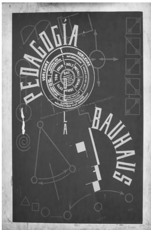
Logotipo de la “BAUHAUS” que se conserva en la Escuela Luján Pérez. Obra de Feininger.

El “Programa” de la “Bauhaus” de Weimar (1919-1933) y el de la “Escuela Luján Pérez” tenían el mismo trasfondo filosófico y pedagógico: interrelacionar las artes promoviendo el trabajo conjunto de técnicos y artistas: arquitectos, escultores, pintores y artesanos, pero ante todo la “Bauhaus”, que nació en 1919, fue ejemplo de una Escuela Oficial basada en la