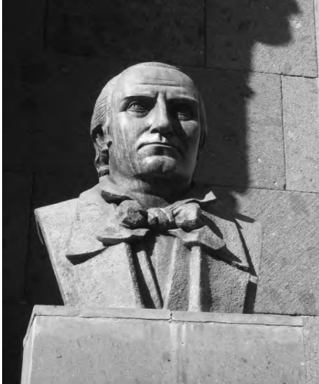
Busto de Luján Pérez en la C/ O. Codina de Las Palmas G.C. Obra de S. Vargas.