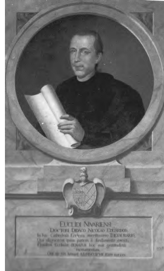
Retrato de Diego N. Eduardo por J.Ossavarry. Catedral de Canarias. Las Palmas de Gran Canaria.

Vega de San Mateo, Valsequillo, Ingenio, San Bartolomé de Tirajana, Santa Cruz de Tenerife, Tejina, Tacoronte, Garachico, La Laguna, La Orotava, Puerto de la Cruz, Los Realejos, San Sebastián de la Gomera y Betancuria, y en Lanzarote: la Virgen de la Encarnación en Haría, el San Andrés de Tao, el Cristo de la Buena Muerte en Tinajo, la Santa Fe del tor-navoz del púlpito de San Ginés en Arrecife, el púlpito de San Bartolomé, lamentablemente destruido en la década de 1970, según recoge Ferrer Perdomo, o el propio titular S. Bartolomé, amén de otras obras desaparecidas como la Virgen de las Mercedes de la Parroquia de Tegui se.