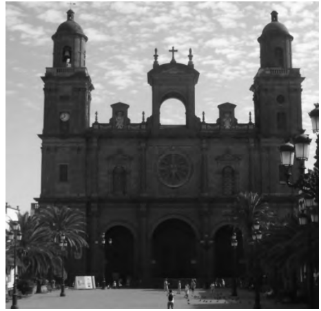
Fachadas de la Iglesia de Guía de G.C. y de la Catedral de Canarias en Las Palmas de G.C. en las que intervino Luján Pérez.