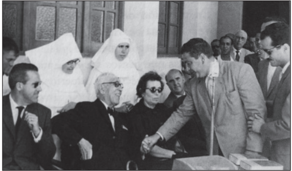
En el día que se pone su nombre a la Sala de hombres del Hospital Insular.

1963. Imposición de las cruces de la Encomienda de la Orden Civil de Sanidad y la Medalla al Mérito en el Trabajo en su categoría de plata, como “reconocimiento a su labor callada y abnegada que no enturbiaron los años ni los desengaños sufridos” 45 .