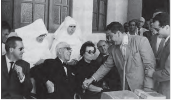
En el día que se pone su nombre a la Sala de hombres del Hospital Insular.

1963. Imposición de las cruces de la Encomienda de la Orden Civil de Sanidad y la Medalla al Mérito en el Trabajo en su categoría de plata, como “reconocimiento a su labor callada y abnegada que no enturbiaron los años ni los desengaños sufridos” 45 .