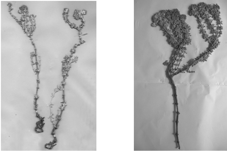
Fig. 2.- Polycarphaea nivea (robusta) recolectada en Montaña Diama (izq.) y recolectada en Foum el Oued -Aiún (dcha.).

cuya distribución se extiende desde el S de Essaouira (cf. BENABID, 2000) hasta el Sahara meridional, Cabo Verde y Canarias (MAIRE, 1963).