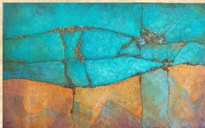
Nacida del Mar