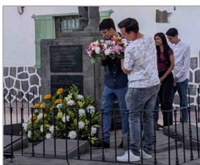
Momentos de la Ofrenda floral ante el Monumento. 22 de mayo de 2025.