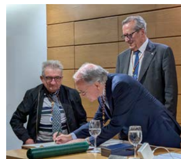
El nuevo Académico firmando en el Libro de Tomas de Posesión de la Academia.

Enlace al Discurso de Ingreso : http://www.academiadelanzarote.es/Discursos/Discurso-127.pdf