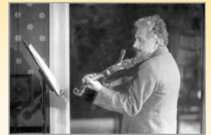
National Geographic. 3-2-2017.

Catedrático de Física de la Universidad Politécnica de Madrid Ex rector de la Universidad de Cantabria