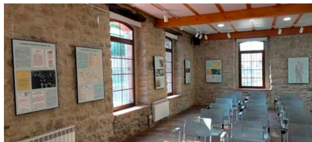
Imágenes de la Exposición, Arenas de Iguña. Agosto 2023.