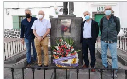
Diferentes imágenes del acto ante el Monumento a Blas Cabrera.