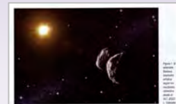
Fig. 1 del artículo de E. de Ferra publicado en Astronomía , 135, pp. 82-86, (sep. 2010).