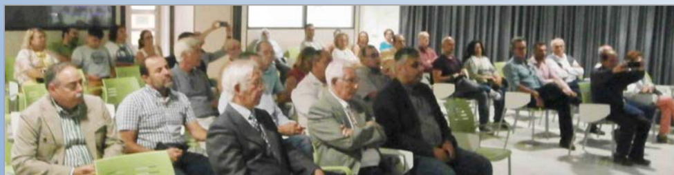
Público asistente al Acto de Toma de Posesión.